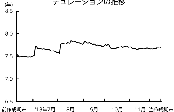
デュレーションの推移

先物取引を利用してデュレーション*の調整を行い、当作成期中は7.5~7.8年程度としました。