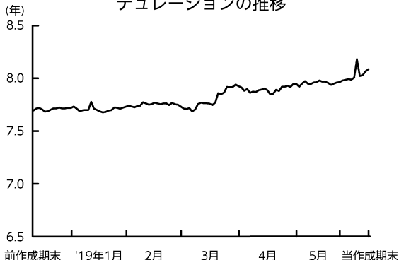
デュレーションの推移

先物取引を利用してデュレーション*の調整を行い、当作成期中は7.7~8.2年程度としました。